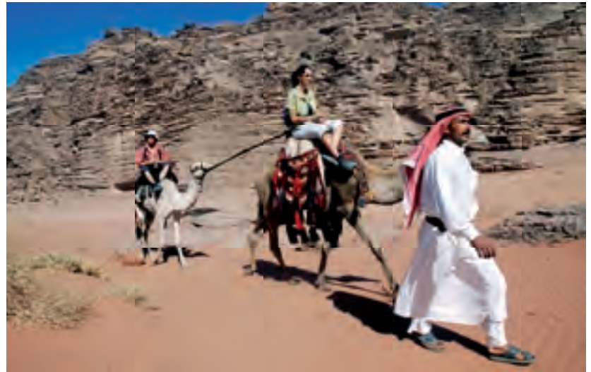
Unten. Die Howeitat vermieten Kamele an Touristen.

➤ gibt es auch heute noch keinen Touristenrummel. Das Land gehört, wie schon zu Lawrences Zeiten, immer noch den Howeitat. Der stolze Beduinenstamm vermietet heutzutage Kamele, Pferde und Landcruiser. Hohe Temperaturunterschiede und die ständig nagende Erosion haben diese vor 30 Millionen Jahren entstandene Bergwüste zu einem fantastischen Felsenzirkus geformt.