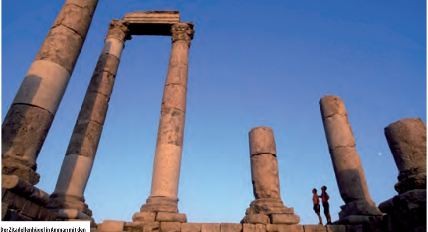
Der Zitadellenhügel in Amman mit den Resten eines Herkules-Tempels.