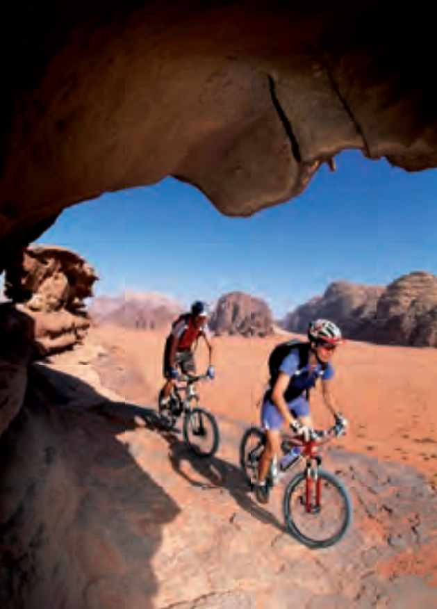
Links. Natürlicher Bikepark: das Wadi Rum.