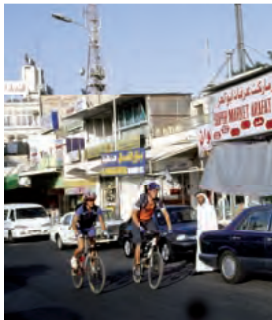
Oben. Jordaniens Hauptstadt Amman.